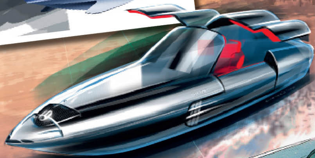
Нарисовал Григорий Чемерис