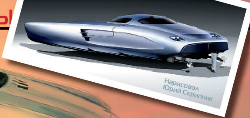
Нарисовал Юрий Скрипник