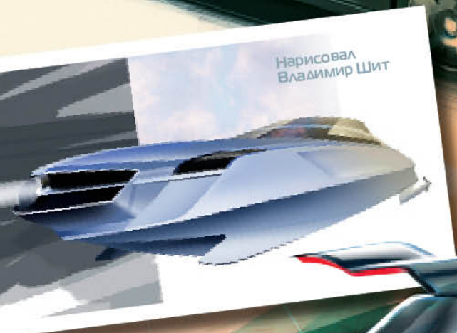
Нарисовал Владимир Шит